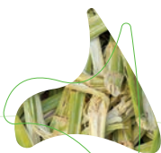
Bagaço de Cana

Formada por um corpo profissional competente e altamente especializado, nossos engenheiros e técnicos possuem anos de experiência no desenvolvimento, detalhamento, inspeções e industrialização de caldeiras, vasos de pressão e tubulações. Estão preparados para trabalhar dentro de normas específicas que cada setor exige utilizando equipamentos, softwares e maquinários adequados, proporcionando maior segurança e qualidade aos produtos.