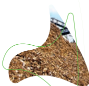
Cavaco de Madeira