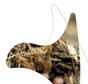
Biomassa em Geral